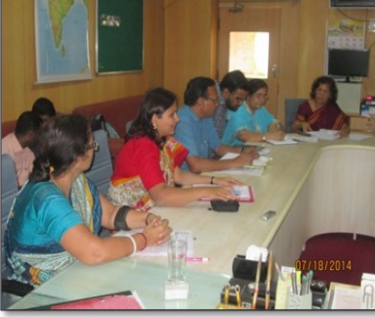
Foundation meeting for